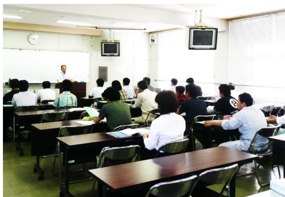
[中堅社員・リーダー研修風景]